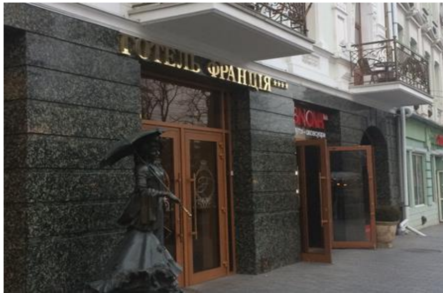
Фотокопія 1. Фасад готелю «Франція»